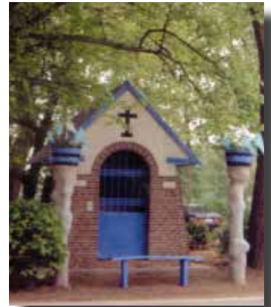
De kapel in Battenbroek ter ere van Onze-Lieve- Vrouw

Alle zijstraten van Walem, die tot dan toe zandwegen waren, liet hij verharderen met het 'afval' dat overbleef bij het aanleggen van de staatsbaan.