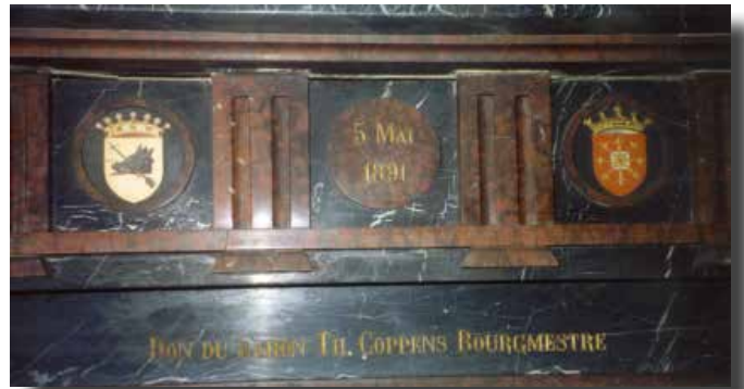
De gedenksteen met de familiewapens zoals hij nu nog steeds te zien is op de eerste verdieping in het dorps huis van Walem.

In 1891 na de renovatiewerken van het gemeentehuis liet de baron in de raadszaal een schouw metselen.