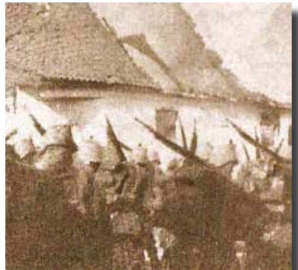
De soldaten van het regiment trekken door Walem dorp nadat het fort gevallen is.

Vooraan de ijzeren K3 VIII SB. De opmars begon 1u30 op voorhand. Om 3 uur bereikte de K3 het fort van Walem. Peloton Höverman met kapitein Schulze-Hoing slingerde zich door het dorp en bezette de rechterkant van de brug maar bleef ongeveer 200 meter van de oever verwijderd. Peloton Tuletz zou in groep door het dorp W tot achter de laatste huizen van het dorp trekken om dan de linkerkant van de brug te bezetten. Hij bereikte echter slechts de hoofdstraat aan de noordelijke rand. Daar kreeg hij een schot in de knie. Intussen geraakte ik met mijn manschappen die zich ook in groep tussen de brandende huizen slingerden achter de noordelijke rand van het dorp. Daar vond ik nog drie groepen van het peloton Tuletz zonder leiding.