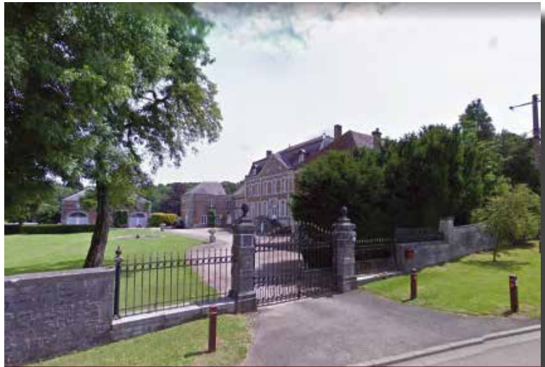
Het kasteel van Humain, het geboortehuis van Theodoor Coppens

Het werd later in de oorspronkelijke stijl gerestaureerd, en in de jaren 90 diende het zelfs als decor voor een film van Maigret.