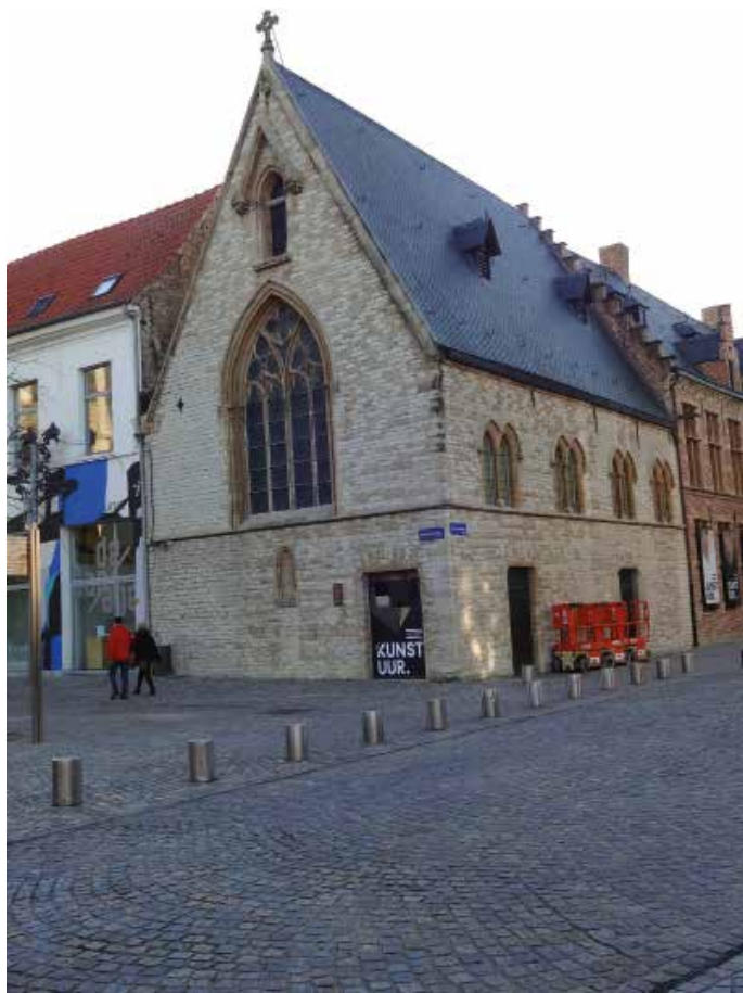
In Mechelen bevond de vondelingenschuif zich in de Heilige-Geestkapel (Onder den Toren)

Over hem zijn we tamelijk goed geïnformeerd dankzij allerlei archiefstukken die in 1999 door Jos Serneels in de kijker werden gesteld. Dit artikel is gebaseerd op de opzoekingen die hij daarover verrichtte*.