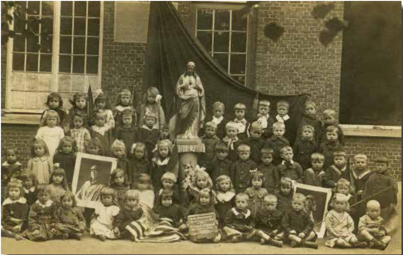
Leerlingen van de meisjesschool danken de Amerikanen en de leerlingen van Indianapolis.

little Belgium', veroorzaakte een vloedgolf van sympathie. Talloze liefdadigheidscomités werden in de VS opgericht om de nodige fondsen te verzamelen. Hoover zette grootschalige mediacampagnes op touw om producten zoals conservenblikken, landbouwmateriaal, brandstoffen en kledij te verzamelen.