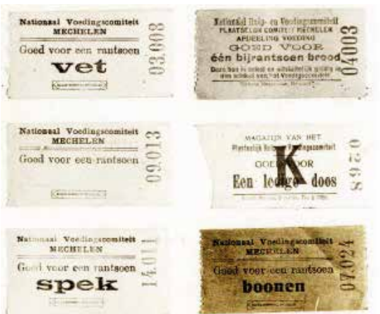
Voedselbonnen van het "Nationaal Hulp- en Voedingscomité".

little Belgium', veroorzaakte een vloedgolf van sympathie. Talloze liefdadigheidscomités werden in de VS opgericht om de nodige fondsen te verzamelen. Hoover zette grootschalige mediacampagnes op touw om producten zoals conservenblikken, landbouwmateriaal, brandstoffen en kledij te verzamelen.