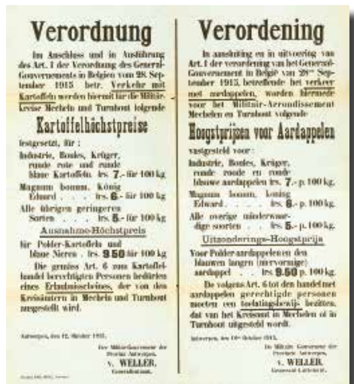
Plakbrief met de verordening over aardappelprijzen van 12 oktober 1915.

Om de initiatieven betreffende internationale solidariteit te structureren, richtte Herbert Hoover – de latere Amerikaanse president – in oktober 1914 de "Commission for Relief in Belgium" (CRB) op. Het beeld dat in de Verenigde Staten opgehangen werd van 'poor