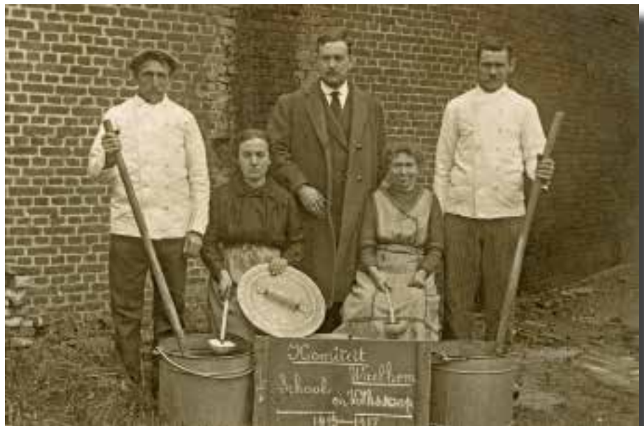
Komiteit Waelhem. School- en volkssoep. 1915-1917.

Bij de plaatselijke comités kunnen de burgers rantsoenen aankopen tegen een gereguleerde prijs. Het distributiesysteem is eenvoudig: elke stad of dorp heeft geheel ondersteunde gezinnen, gedeeltelijk ondersteunde gezinnen en niet-ondersteunde gezinnen. Iedereen had recht op evenveel, alleen moest niet iedereen er even veel voor betalen. Voor elk product was een kaart nodig: een broodkaart, een kolenkaart, een aardappelkaart, een boterkaart, een gezinskaart, enzovoort. Bij elke aankoop werd de kaart afgestempeld: geen kaart is geen eten!