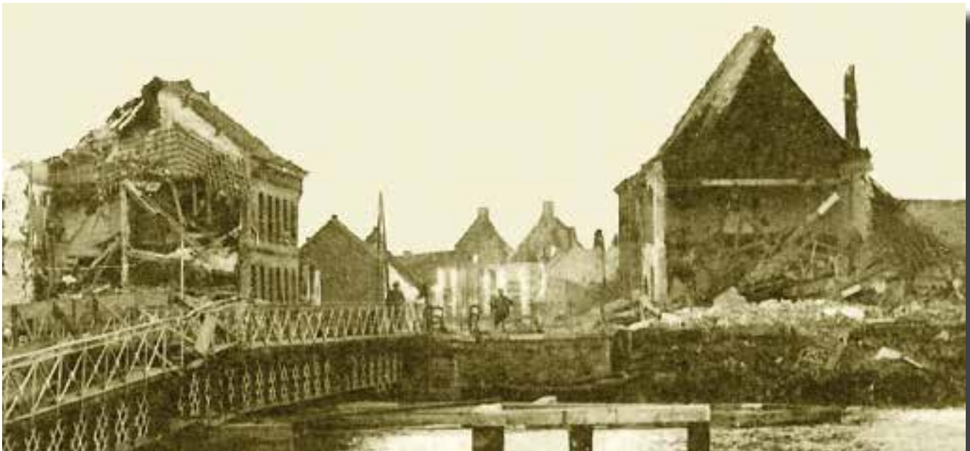
Zicht op de vernielde huizen aan de Rechtestraat van over de brug over de Nete na de beschietingen van eind september-begin oktober 1914.

Wanneer op 28 september de beschieting van het fort een aanvang nam en ook de dorpskern door een aantal granaten werd getroffen sloegen ook de laatste Walemnaars op de vlucht. De meesten kwamen in de stroom van één miljoen Belgische vluchtelingen terecht die de grens met het neutrale Nederland overstaken. Volgens de pastoor bleven er slechts 8 inwoners achter.