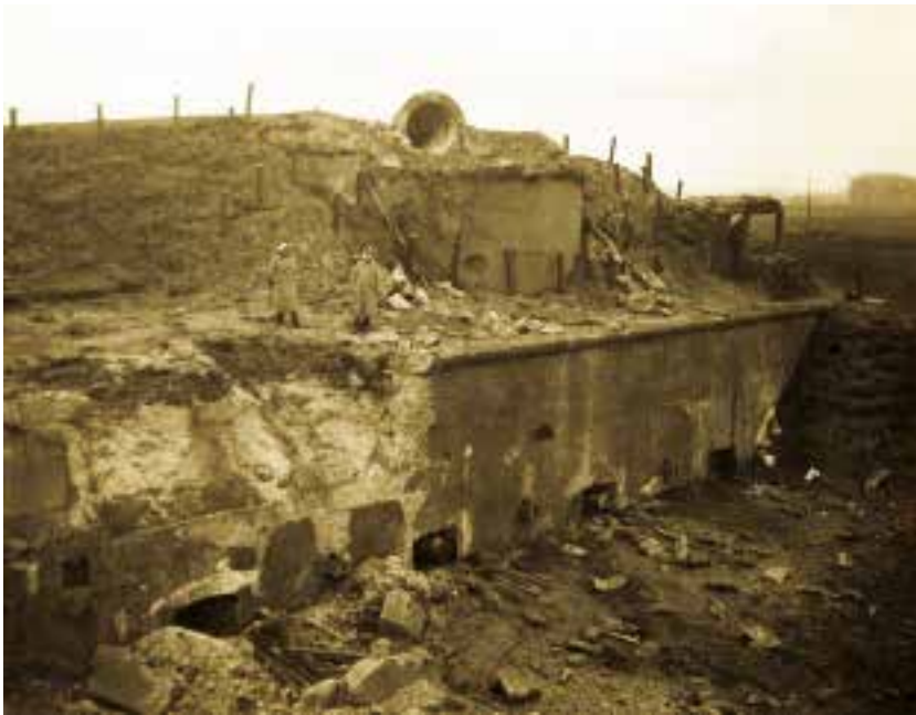
Het fort van Walem in 1914 met hier de schade van de inslag op de rechter caponnière.

De opruim van de eerste maanden na 1914 werd doorgezet in de jaren 20. Op het fort werd schade hersteld en onherstelbare ruimtes werden afgesloten, ook werden er nog een aantal lichamen geborgen. In het dorp werden huizen hersteld of van de grond af heropgebouwd, en de landbouwgrond rond het fort werd terug in gebruik genomen. Waar de obussen in 1914 hadden inslagen en grote kuilen hadden achtergelaten, werd het oppervlak weer gelijk getrokken, zeker na jarenlang zaaien en maaien.