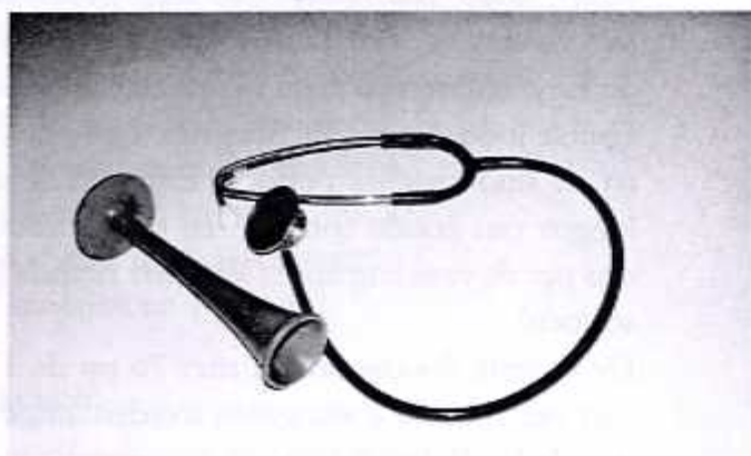
Vervolg op blz. 11...

Samengevat kunnen we stellen dat de diagnose stuipen in feite geen diagnose is, maar wel een symptoom te wijten aan een niet vermelde oorzaak of infectie. Diagnosestelling verliep in die periode ook zeer gebrekkig en was dikwijls een gissen naar. Hulpmiddelen als bloedonderzoek, radiografie ontbraken ook volledig. De dokter moest met zijn Laënnec-stethoscoop (pas in 1824 uitgevonden - zie foto, naast een moderne stethoscoop) zijn klinisch onderzoek en met zijn ervaring de diagnose stellen.