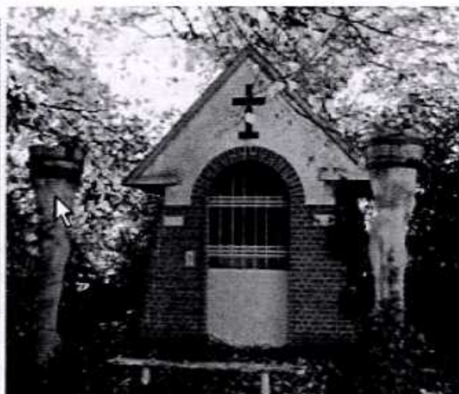
Gebouwen welke zullen verdwijnen voor het GOG-gebied grote vijver deel 2: de brasserie Battenbroek en de kapel van Battenbroek.