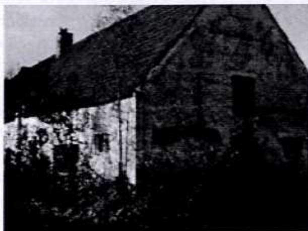
De 'Polderhoeve' welke gespaard blijft

De nieuwe ringdijk sluit dus aan achter het kasteel en gaat door achter de 'Polderhoeve', welke gespaard blijft, en zo langs de 'Pretersweg' (langs de linkerzijde van de foto) naar de Nete toe. De Netedijk wordt verlaagd tot 6,50 m TAW, behalve tussen de 2 voetgangersbruggen over Nete en Dijle: daar blijft de dijk op het huidige niveau. De Dijledijk wordt verlaagd tot een hoogte van 7 m TAW (zelfde hoogte als de dijk tussen deel 1 en 2).