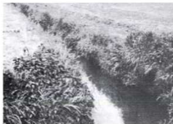
Gracht - kanaal voor bevoeiing.

Het bevoeien van de weilanden gebeurde na elke maaibeurt per polder. Vloeibeemden laten een goede irrigatie toe welke niet alleen een optimale aan en afvoer van water toeliet, maar het bevoeien met rivierwater bracht ook slib (aluvium) op het grasland, wat de groei bevorderde. In het boek "De vrije aerde van Battenbroeck wijlen E.H.A. Goetstouwers" kunnen wij lezen "Battenbroeck dankt zijn vruchtbaarheid aan God en de Nethen".